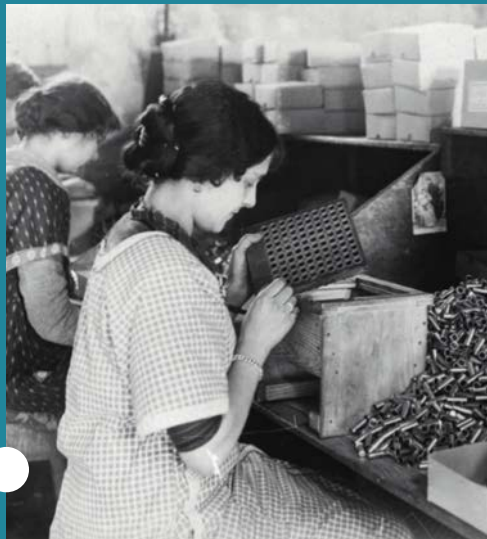
Atelier d'emballage d'amorces, 1916

(Tarifs : 5 € / étudiants 3 € / minima sociaux 2 €)