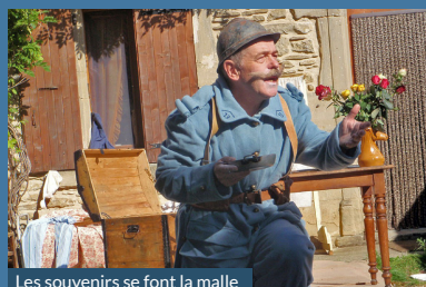
Les souvenirs se font la malle