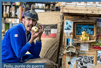
Poilu, purée de guerre