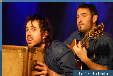
Le Cri du Poilu