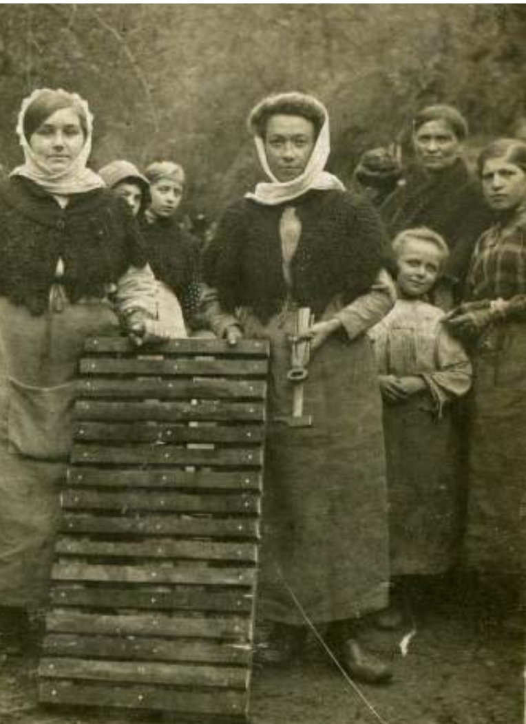
abrication de caillebotis de tranchées.