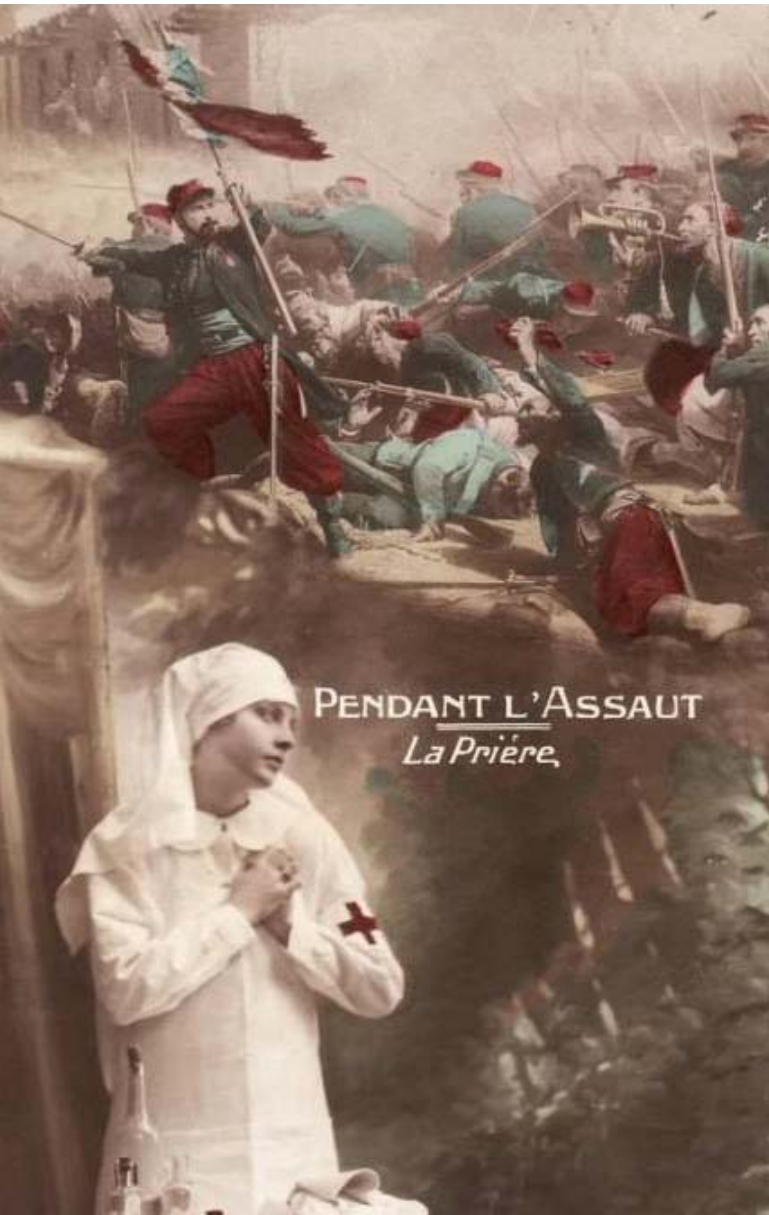
PENDANT L'ASSAUT La Prière,